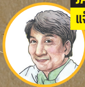
JACKIE CHAN แจ็กกี้ ชาน (เจินหลง)

ผมเป็นนักแสดงครับ พ่อแม่ผมอพยพจากประเทศจีนมาฮ่องกง เพราะสงครามทางการเมืองตั้งแต่ผมยังไม่เกิด ผมเฝ้ารอที่เล่นหนังเรื่อง Rush Hour หรือ วิ่ง ลู่วิ่ง