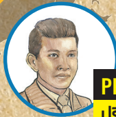
PRIDI BANOMYONG ปรีดี พนมยงค์