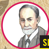
SIGMUND FREUD ซิกมุนด์ ฟรอยด์

ผมเป็นนักประสาทวิทยาและนักจิตวิทยาจิตวิเคราะห์ ผมเกิดที่เมืองโมราเวีย ในอดีตจักรวรรดิออสเตรีย หลังจากนั้นครอบครัวจึงย้ายไปยังเวียนนา ประเทศออสเตรีย และอพยพไปยังกรุงลอนดอน สหราชอาณาจักร ในช่วงที่การคุกคามจากนาซีขยายตัวขึ้น