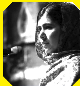
มาลาลา ยูซาฟไซ

“แสงสว่างของเปลวเทียนไม่ได้ลุกโชนเพื่อพวกเรา แต่เพื่อผู้คนที่เราไม่สามารถช่วยให้เขาออกมาจากคุกได้ เพื่อผู้ที่ถูกยิงระหว่างส่งตัวไปเรือนจำ เพื่อผู้ที่ถูกทรมาน เพื่อผู้ที่ถูกลักพาตัว เพื่อผู้ที่ ‘หายตัวไป’ นั่นคือความหมายของเปลวเทียน”