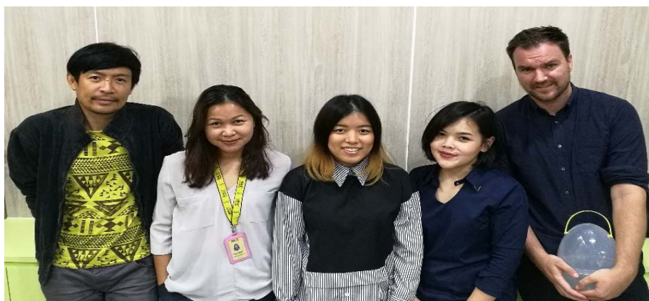
ภาพ 8: ฝ่ายสมาชิกและการระดมทุนผู้แข่งขัน