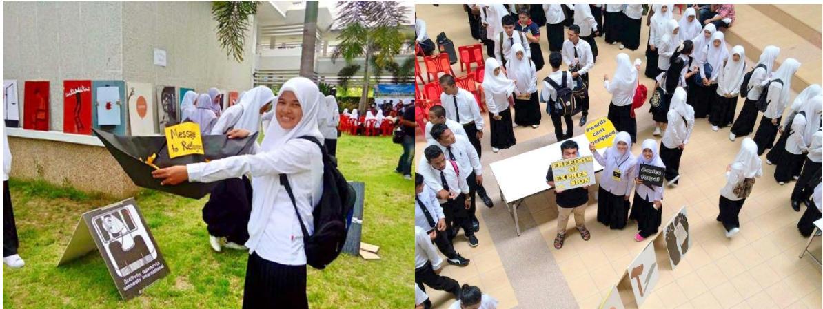
ภาพ 3: การจัดกิจกรรมรณรงค์เพื่อสิทธิของผู้ลี้ภัย และการรณรงค์ประเด็นสิทธิในการแสดงออกโดยนักกิจกรรมนักศึกษามหาวิทยาลัยสงขลานครินทร์ วิทยาเขตปัตตานี