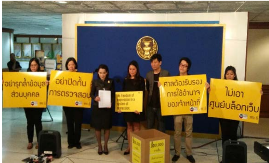
ภาพ 4: การรณรงค์เรื่องพ.ร.บ.คอมฯที่เป็นที่สนใจของสังคมในกลางปีที่ผ่านมา