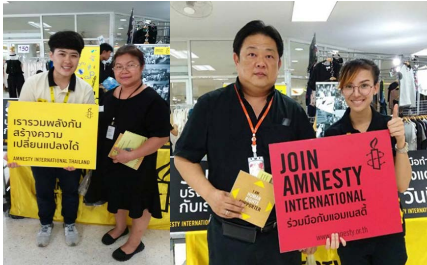
ภาพ 7: การระดมทุนโดยทีมขององค์กรในห้างสรรพสินค้า