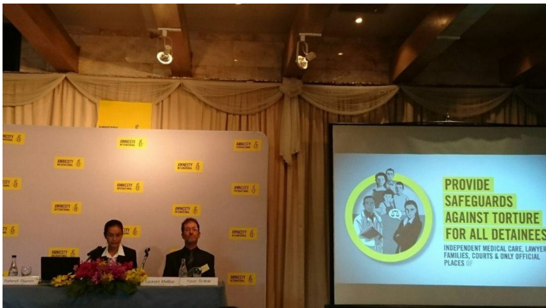
ภาพ 5: เวทีเปิดตัวรายงานการซ้อมทรมานในประเทศไทย โรงแรมไฟว์สตาร์ กรุงเทพฯ 26 ก.ย.2559