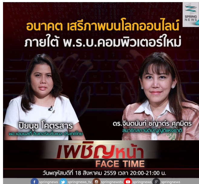
ภาพ 5: แอมเนสตี้ได้รับเชิญให้ไปร่วมรายการโทรทัศน์หลายรายการ เช่น รายการเฟซบุ๊กหน้า Face Time