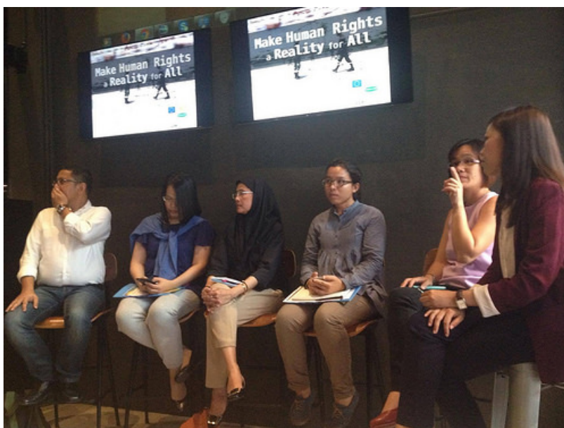
ภาพ 6: เวทีถ่ายทอดสดการทบทวนสถานการณ์สิทธิมนุษยชนและพูดคุยเรื่องสถานการณ์สิทธิ ที่ Black Box Cafe&Bar 11 พ.ค. 2559