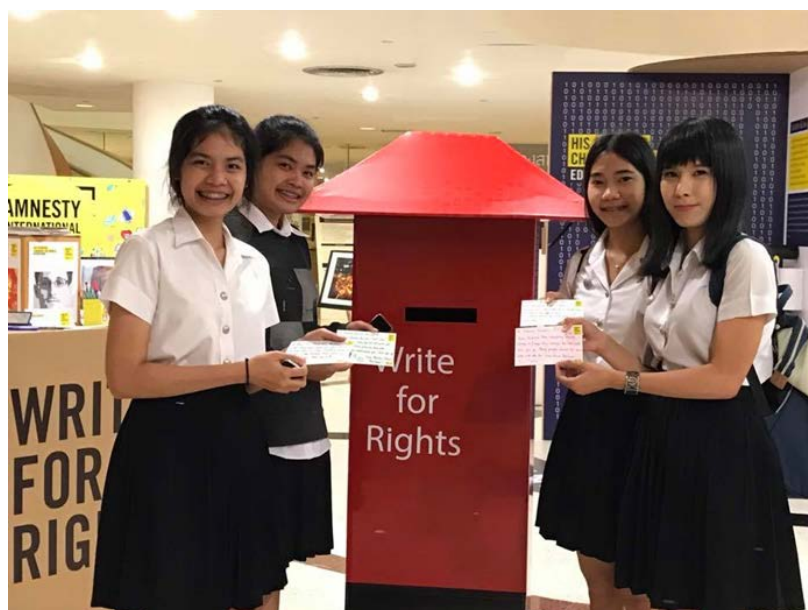
ภาพ 2: นิทรรศการและกิจกรรมการเขียนจดหมายเพื่อผู้ที่ออกมาขับเคี่ยวรณรงค์ประเด็นเกี่ยวกับสิทธิมนุษยชน ณ หอศิลป์และวัฒนธรรมกรุงเทพ ซึ่งเป็นส่วนหนึ่งของโครงการรณรงค์ Write for Rights 2016