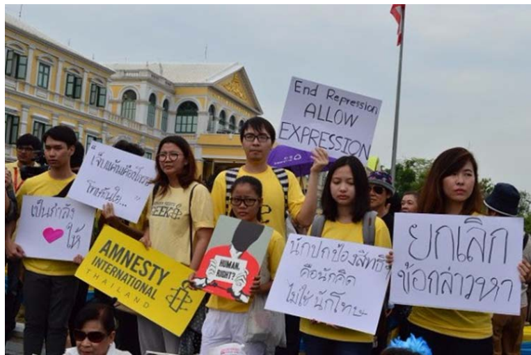
ภาพ 1: การให้กำลังใจนักกิจกรรมทางการเมือง กรณีแจกเอกสารเกี่ยวกับการประชุมติ 5 ก.ค. 59 หน้าศาลทหาร กระทรวงกลาโหม