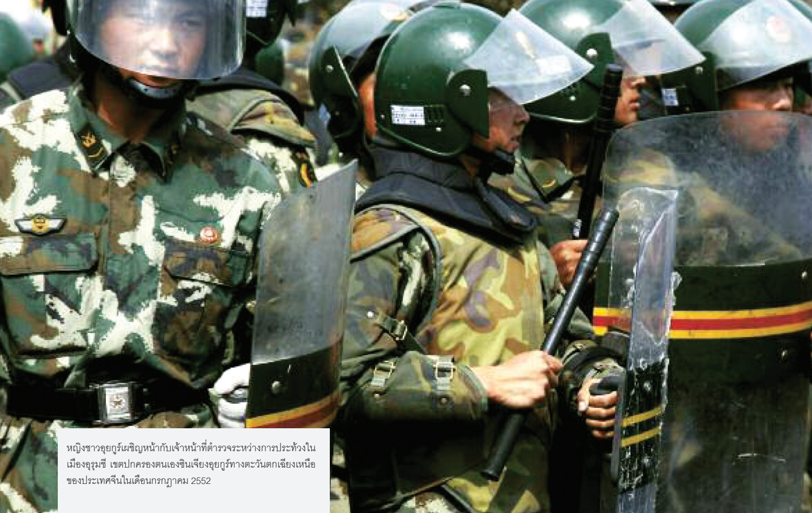
หญิงชาวอุยกูร์เผชิญหน้ากับเจ้าหน้าที่ตำรวจระหว่างการประท้วงใน เมืองอุรุมชี เขตปกครองตนเองซินเจียงอุยกูร์ทางตะวันตกเฉียงเหนือ ของประเทศจีนในเดือนกรกฎาคม 2552