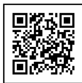
QR Code สำหรับลงทะเบียน

การที่สถานศึกษาให้การยอมรับว่ากลุ่มของคุณเป็นกลุ่มทางการของแอมเนสตี้ อินเตอร์เนชั่นแนลนั้นสามารถช่วยให้คุณจัดกิจกรรม ระดมทุน และทำสิ่งอื่นๆ ได้อีกมาก แต่ละสถานศึกษามีกฎเกณฑ์ในการจัดตั้งกลุ่มนักเรียนที่ต่างกัน คุณจึงควรทำงานร่วมกับอาจารย์ที่ปรึกษาเพื่อตรวจสอบนโยบายและระบบระเบียบต่างๆ ของโรงเรียน ในกรณีที่กลุ่มประสบปัญหาหรือต้องการการสนับสนุนในเรื่องใดก็ตาม เช่น ต้องการตัวอย่างรัฐธรรมนูญหรือคำแนะนำในการดำเนินตามนโยบายของโรงเรียน ให้คุณปรึกษาเจ้าหน้าที่ฝ่ายจัดกิจกรรมภาคสนาม